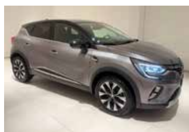
RENAULT CAPTURE , CC. 1.0, TCE, TECHNO, 90CV, ANNO 03.2024, € 19.890,00 FABIO CARS TEL. 0933.21630

RENAULT TWINGO , cc. 1.2, colore nero, anno 2008, € 3.700,00 AUTOSERVICE BUSCEMI AUTO TEL. 0933/51554