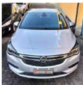
OPEL-ASTRA SW , ANNO 2017, KM170.000 € 10.800,00 USATO GARANTITO BUSCEMI AUTO TEL. 0933.51554

OPEL ANTARA , cc. 2.2, cdti, 163cv, cosmo, anno 10/2012, colore bianco, € 4.000,00 ALESSI & MESSINA TEL. 0933/22306 OPEL CORSA , cc. 1.2, gpl, 85cv, colore bianco, anno 2011, € 4.600,00 AUTOSERVICE BUSCEMI AUTO TEL. 0933/51554