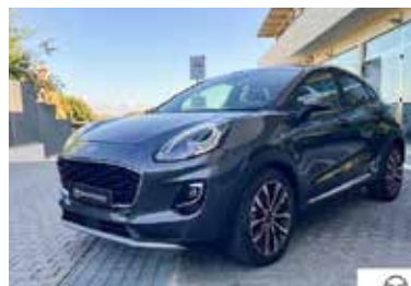
FORD PUMA , CC. 1.0, ECOBOOST, 125CV, ANNO 12.2023, € 18.490,00 ALESSI & MESSINA TEL. 0933 / 22306 - 22068