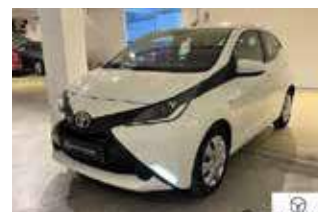
TOYOTA AYGO , CC. 1.0, 69CV, X-WAVE, ANNO 022017, € 8.500,00 ALESSI & MESSINA TEL. 0933 / 22306 - 22068