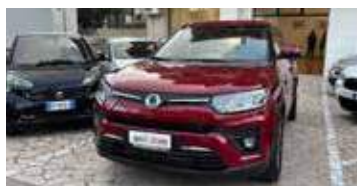
SSANGYONG TIVOLI , CC. 1.6, EXCLUSIVE, 136CV, ANNO 122020, € 13.490,00 AMATO MOTORS TEL. 0933/28203 335/7491566

SSANGYONG TIVOLI , cc. 1.6, exclusive, 136cv, colore rosso, anno 12/2020, € 13.490,00 AMATO MOTORS INSURANCE TEL. 0933/28203