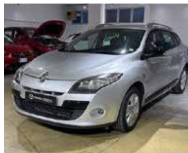
RENAULT , CC. 1.5, DCI, 90CV, SPORT TOUR, WAVE, ANNO 5.2012, € 4.200,00 ALESSI & MESSINA TEL. 0933 / 22306 - 22068

RENAULT , cc. 1.5, dci, 90cv, sport tour wave, anno 05/2012, colore grigio mtz, € 4.200,00 ALESSI & MESSINA TEL. 0933/22306 RENAULT CAPTURE , cc. 1.0, techno, 90cv, colore grafite, anno 03/2024, € 19.890,00 FABIO CARS TEL. 0933/21630