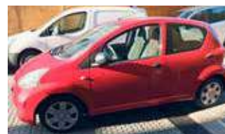
TOYOTA AYGO , CC. 1.0, 12V, ANNO 2009, € 4.300,00 USATO GARANTITO BUSCEMI AUTO TEL. 0933.51554