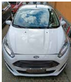
FORD FIESTA , CC. 1.5, TDCI, START & STOP, ANNO 10/2017, € 8.200,00 USATO GARANTITO BUSCEMI AUTO TEL. 0933.51554