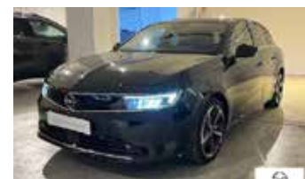
OPEL ASTRA , CC. 1.6, 180CV, BUSINESS, ELEGANCE, HYBRID, € 24.950,00 ALESSI & MESSINA TEL. 0933 / 22306 - 22068