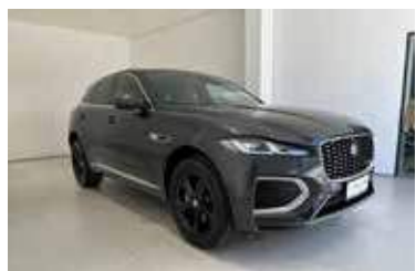
JAGUAR F-PACE , CC. 2.0, 204CV, ANNO 03.2021, € 34.290,00 FABIO CARS TEL. 0933.21630

JAGUAR E-PACE , cc. 2.0, 150cv, colore bianco, anno 12/2018, € 21.950,00 AMATO MOTORS INSURANCE TEL. 0933/28203