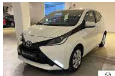
TOYOTA AYGO , CC. 1.0, 69CV, X-WAVE, ANNO 02.2017, € 8.500,00 ALESSI & MESSINA TEL. 0933 / 22306 - 22068