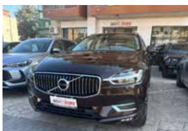
VOLVO XC60 , 2.0, INSCRIPTION, 190CV, ANNO 06.2019, € 24.980,00 AMATO MOTORS TEL. 0933/28203 335/7491566