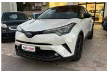
TOYOTA C-HR , CC. 1.8, 98CV, ANNO 04.2017, € 14.490,00 AMATO MOTORS TEL. 0933/28203 335/7491566